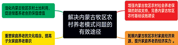
图3 解决内蒙古农村牧区养老模式问题有效途径示意图