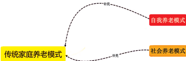
图1 三种养老模式逻辑关系

农村牧区是指以畜牧业和传统农业生产为主的地区。内蒙古农村牧区的养老模式体现了传统与现代的融合。由于经济发展水平和资源限制,牧区农村养老资源选择相对单一,且与城市和内地农村存在显著差距。受传统文化和社会结构的影响,家庭养老模式在牧区农村仍占主导地位。然而,随着社会经济发展和人口老龄化问题的加剧,社会养老和自我养老可在一定程度上对传统家庭养老模式进行补充,如图1所示。社会养老涉及社会服务和政府支持,而自我养老则依赖于个人经济独立性和健康状况。综上所述,内蒙古牧区农村地区的养老模式的发展正处于传统与现代交织的转型期。